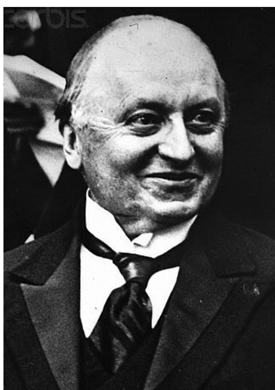
Джордж Натаниел Керзон (George Nathaniel Curzon, 1st Marquess Curzon of Kedleston, 1859—1925), английский государственный деятель, публицист и путешественник. Вице-король Индии (1899—1906), министр иностранных дел Великобритании (1919—1924), лидер палаты лордов (1916—1925), лорд-президент Совета (1916—1919, 1924—1925)

Условную жесткость границ подчеркивал и лорд Дж. Керзон, один из первых исследователей этой проблемы. Лорд Дж. Керзон ввел термин «буферное государство» для обозначения государственных образований на границах двух государств, между которыми жесткая граница невозможна [Керзон 1893, 1911]. Как правило, буферные государства отличаются экономической и политической нестабильностью, т.к. являются ареной скрытой геополитической борьбы более мощных государств.