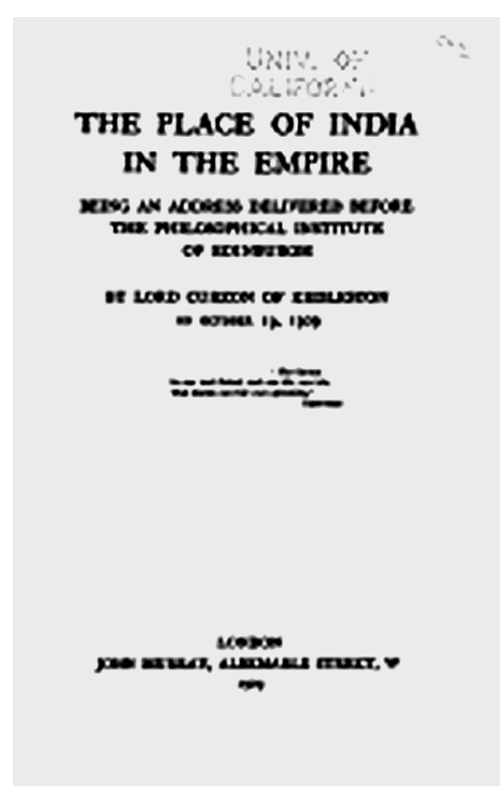
Титульный лист работы лорда Керзона «Положение Индии в империи» (1909).

В 1962 г. К. Боулдинг выделил особый вид границ между макрорегионами — «критические границы» [Boulding 1962] (см. также [Boulding 1975]). Они складываются в тех случаях, когда крупные державы стремятся защитить свои интересы за пределами своей юридически очерченной территории. Концепция Боулдинга связана с понятиями «сфера влияния» и «сфера жизненных интересов». Примеры концепций, обосновывавших критические границы США и СССР в разные эпохи их развития — это соответственно доктрины Монро и Брежнева. Данные доктрины основаны на том, что каждая держава имеет за