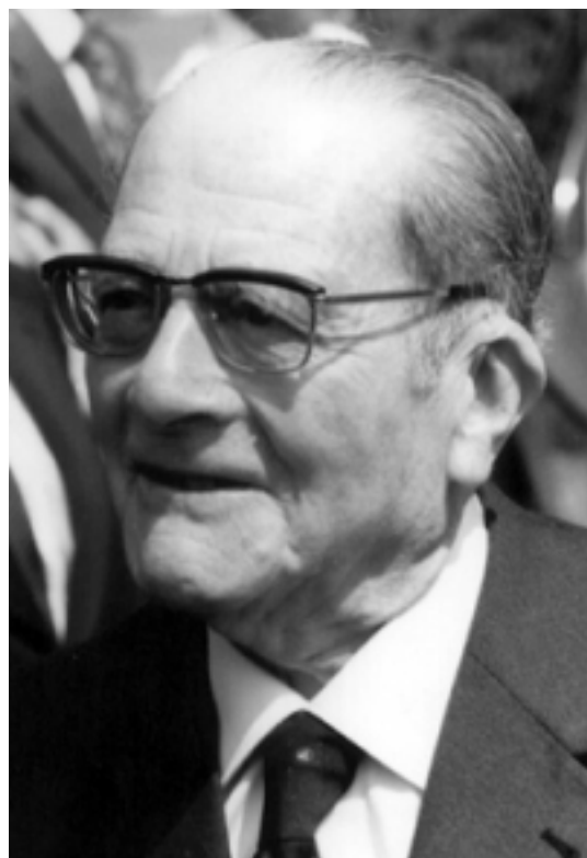
Карл Шмитт (Carl Schmitt, Karl Schmitt, 1888—1985), немецкий юрист и политический философ

Карл Шмитт ввел еще одно понятие для обозначения геополитического пространства, которое является поясом защиты для мощной державы и отстаивается ею как зона собственных интересов — Großraum [Schmitt 1941, 1995]. В данном случае «большое пространство» образуется совокупностью государств, сходных по культуре и/или религии.